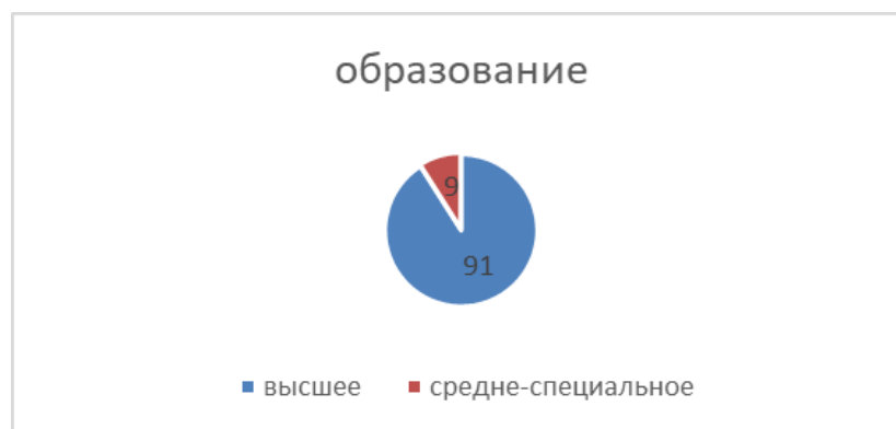
Диаграмма с характеристиками кадрового состава ЦО «Непоседа»

Образовательный ценз педагогов: высшее образование имеют – 10 человек (91%); среднее специальное образование – 1 человека